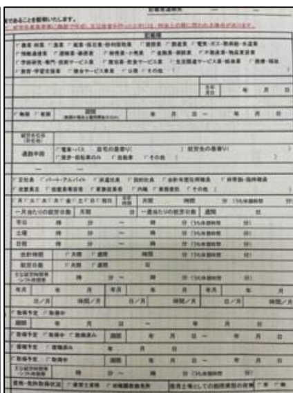
(書類全体が分からない)