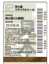
既製品用シール (見本)