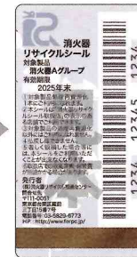
新品用シール (見本)

製品にはリサイクルシールが貼られています。耐用年数を過ぎたら、取り扱い窓口へ引き渡してください。