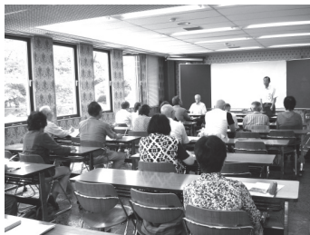
地域の歴史について学ぶ参加者

参加した受講生24名は、安達地方の歴史や変革、発展についての講話を聴き、地元の歴史文化に思いをはせていました。