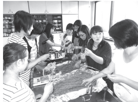
ラベンダーの香りを楽しみながら作りました

楽しんでいました。また、リップクリームでは、ラベンダーの精油や蜜蝋を混ぜながら自分の好きな香りを選んで作りました。