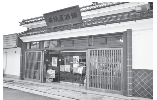
▲本宮いどばた会で運営する子ども文庫「井筒屋」

トレス解消のための屋内遊び場として、NPO法人本宮いどばた会が主体となり、ここに子育てひろばを開設しました。そこで子どもたちは、自由に絵本を読んだり、お絵かきや木のおもちゃで遊んだりしています。また、スタッフによるお話し会や、「ママカフェ」と称してお母さんたちの交流の場を提供したり幅広い事業を行っています。 開設から3年たった現在でも、多くの親子連れがボランティアさんの絵本の読み聞かせに耳を傾けていました。