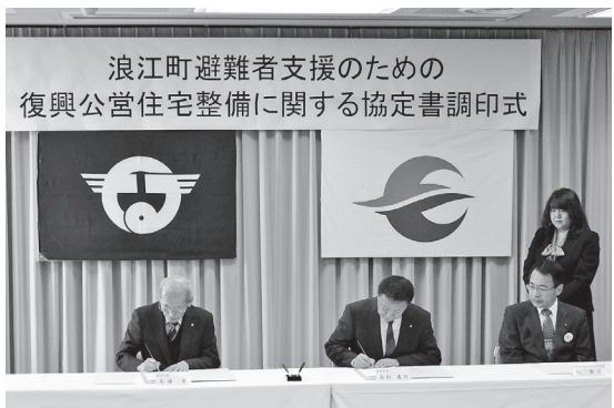
▲1月に調印された復興公営住宅整備に関する協定書

1月14日、浪江町と本宮市が復興公営住宅整備の協定書を取り交わし、今後は早期の完成を目指して整備を進めます。