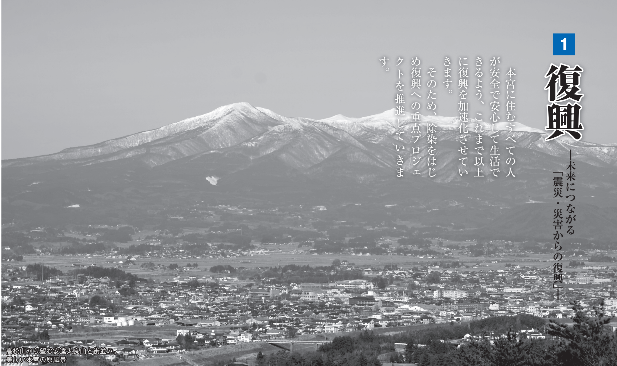
高松山から望む安達太良山と街並み。美しい本宮の原風景

本宮に住むすべての人が安全で安心して生活できるよう、これまで以上に復興を加速化させていただきます。 そのため、除染をはじめ復興への重点プロジェクトを推進していきます。