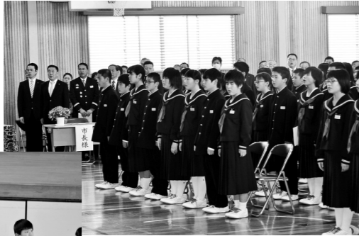
▶白沢中学校入学式 ▼五百川小学校入学式

各学校とも、校長先生をはじめ来賓の方々からお祝いの言葉が贈られました。新入生は、希望を胸に緊張した面持ちで式に臨みました。