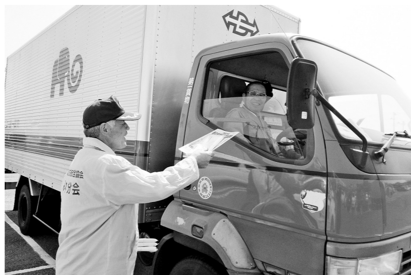
▲ドライバーにチラシを配り交通安全を呼びかけました

4月6日から15日まで、春の全国交通安全運動が全国一斉に展開されました。運動に先立ち4月5日に、郡山北警察署本宮分庁舎で管内関係機関・団体が参加し合同出勤式が行われました。式終了後、市内パレードを行い、交通安全を呼びかけました。