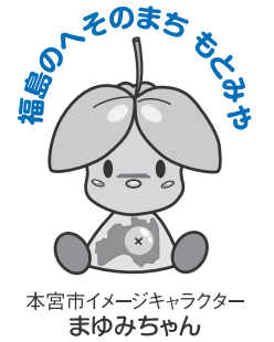
本宮市イメージキャラクター まゆみちゃん