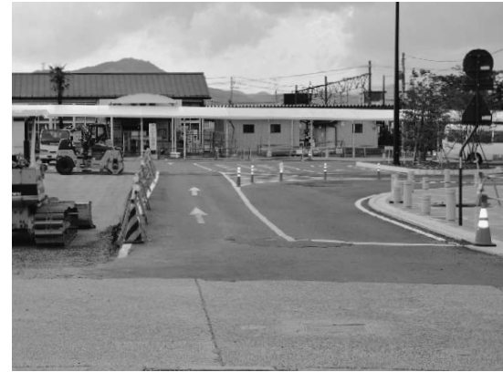
工事が進む本宮駅前東口広場