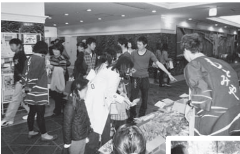
▲(写真上)日本大学経済学部の三崎祭の様子 (写真下)相模女子大学の相生祭の来場者の皆さん