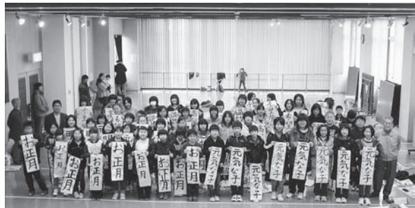
▲中央公民館の参加者の皆さん