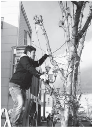
▲高所作業車や脚立を使って街路樹1本1本にキラキラ輝くイルミネーションを取り付けました。