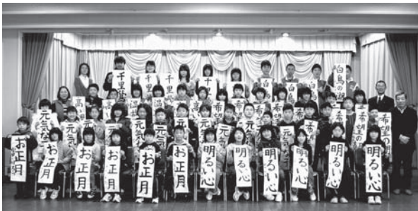
▲白沢公民館の参加者の皆さん