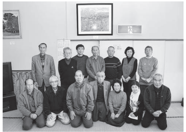
▲毎年30数点の作品を老人憩いの家に飾りつけています

老人憩いの家の利用者の皆さんの目と心の安らぎになればと計画しており、会長は「今後も活動を続け、少しでも地域の皆さんのお役に立てれば…」と話していました。