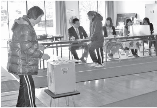
和田投票所の様子

大学を卒業後、旧本宮町職員として5年間勤務。平成7年からは本宮町議会議員を3期、平成19年から市議会議員を2期務め、市議会初代議長を務めました。