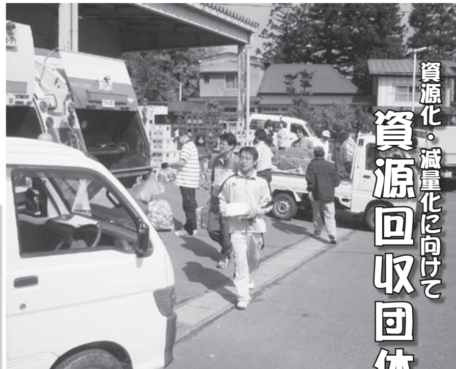
▲資源回収を行う和田小学校PTAのみなさん

本宮市では、ごみの減量化を図るため家庭から出された再生利用可能なごみを集団回収している団体に、報償金を交付しています。現在、50団体の登録があり、ごみの減量化に協力していただいています。 集団資源回収を実施していただくことで、資源物の有効活用や、ごみの減量化が図られ、ごみ処理費用も軽減できます。また、集団回収を実施した団体には、1キロあたり6円の報償金が交付されます。皆さんも参加してみませんか？