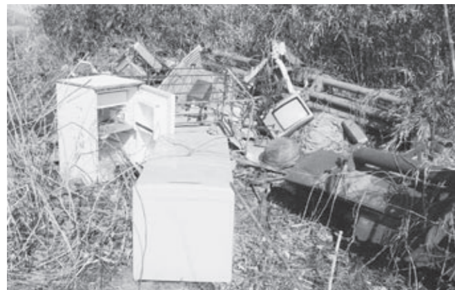
残念です...不法に捨てられた廃棄物

投棄された廃棄物を撤去して元の状態に回復させるには、初めから適正に処分するよりも、多大な費用と長期の時間を要し、経済的損失も計り知れないものとなります。