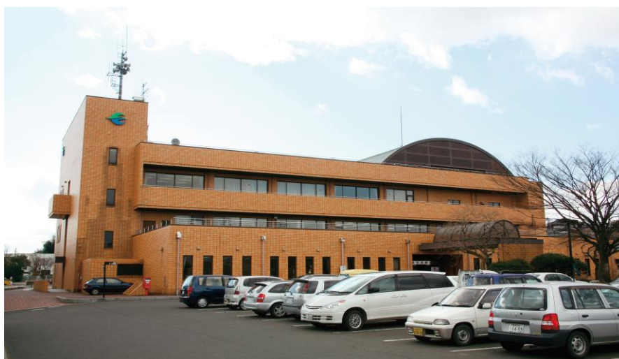
本宮市役所 本庁舎

現在、本宮市役所では「本宮市役所地球温暖化防止実行計画（第 2 次改訂）」に基づき、全庁で地球温暖化対策に取り組んでいます。本庁舎、総合支所、保健福祉施設及び教育施設など公共施設において取り組んでいます。