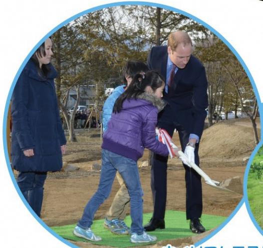
ウィリアム王子による イングリッシュオーク の記念植樹 2015年(平成27年)2月28日