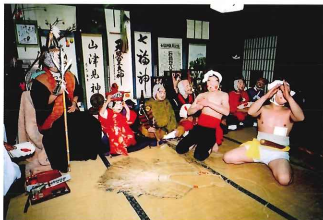
八ッ田内七福神舞