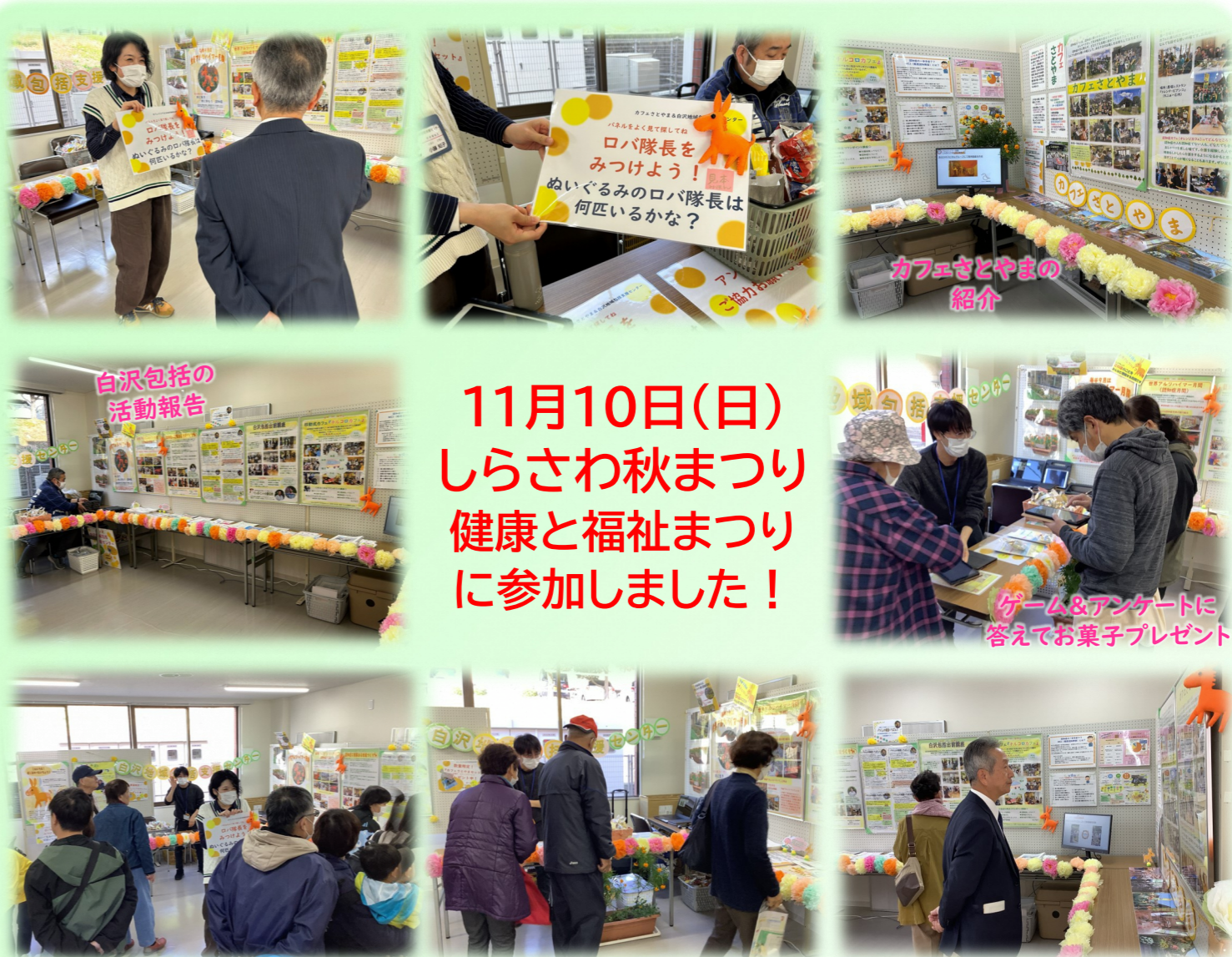
白沢包括の 活動報告