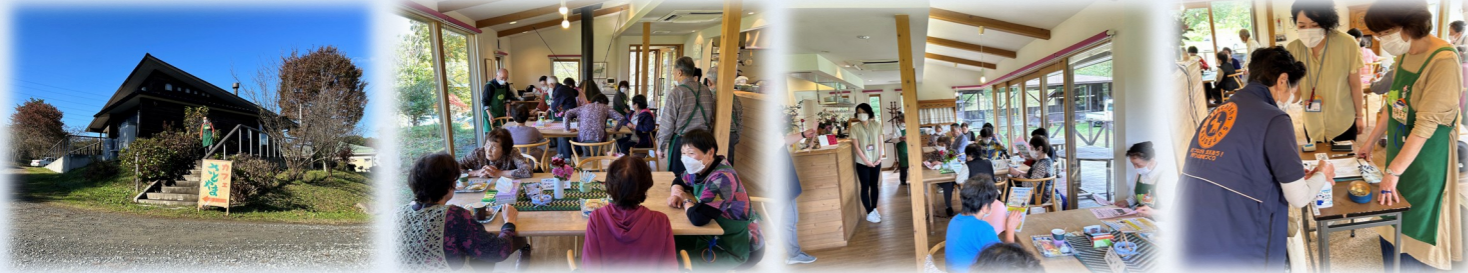
ボランティアのみなさんと秋まつりの用意をしました

毎月1回、オレンカジフェ(認知症カフェ)を開催しています。 なんでも話せる憩いの場です。事前予約の上、お越しください♪