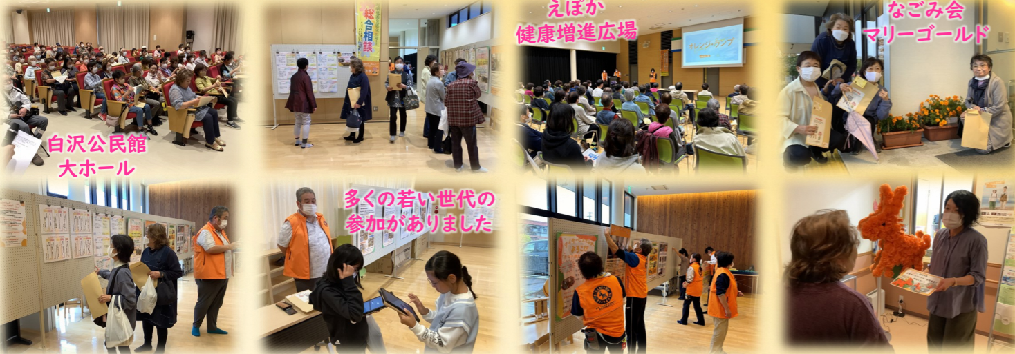
えぽか 健康増進広場