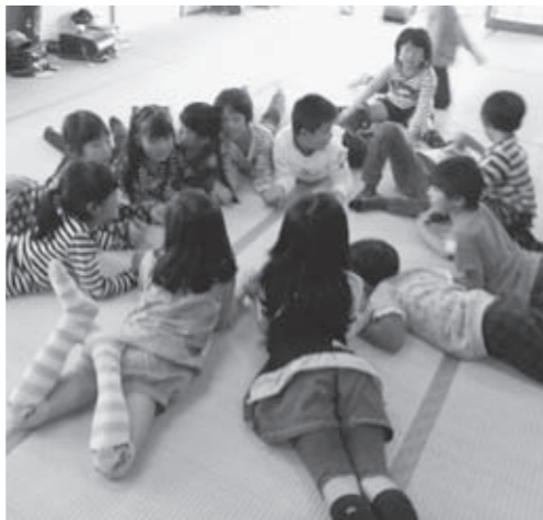
▲みんな輪になってお話ししよう

放課後子ども教室がスタート! 遊友クラブが始まりました! 放課後子ども教室「本宮市遊友ク ラブ」は、市内の全小学校区にある 7教室で、多くの子どもたちを迎え 元氣よくスタートしました。 遊友クラブでは、小学生を対象に、 安心・安全な場を提供し、体験活動 や学習活動を通じて子どもたちの健 全な育成に取り組んでおり、今年も、 工作や昔遊び、おはなし会など各ク ラブの特性を生かしたさまざまな内 容の活動を予定しています。 また、地域の方にスタッフとして参