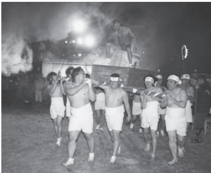
勇壮な裸御輿の担ぎ手たち▶