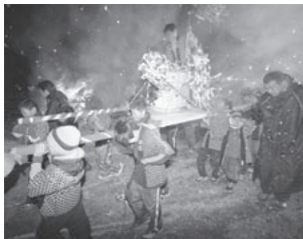
▲強風で火の粉が舞うなか、子どもみこしをかつぐ子どもたち