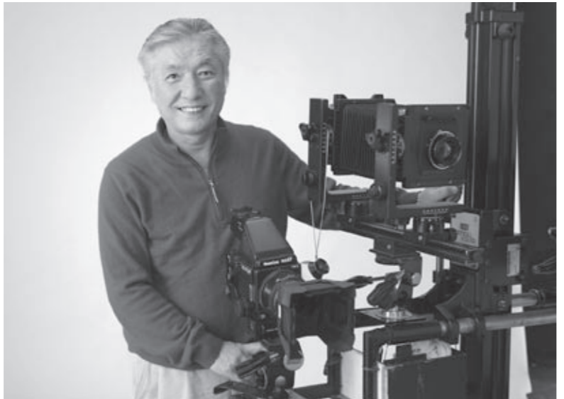
カメラ以外にも実に多くの機材を使いこなす技術も必要。笑顔の裏では「一生に一度の写真は撮り直しはきかない」と気を張る。

「世界にどれだけ通用するか、コンテストで自分の腕を磨き続けたい」と抱負を語る。今日も真剣に写真と向き合う、笑顔を決やさない匠だった。